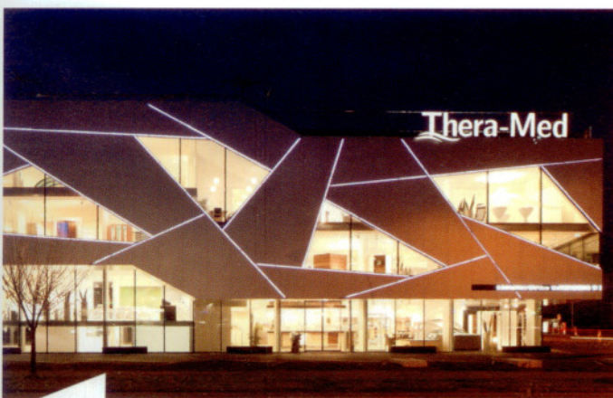
Für die Delfin Wellness GmbH in Leonding (A) setzte der Architekt Michael Haderer (Architektur Werkstatt Pregarten) auf alucobest Verbundplatten, die bei Nacht in weißem LED-Licht strahlen. Jede einzelne Platte besitzt eine Sonderform.

Als Zulieferer der Baubranche ist concentra auf die Materialien Aluminium, Glas, Premiumkunststoffe, Fassadenplatten und Designprodukte spezialisiert.