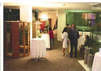
Alles auf einen Blick: Das Ausstellungskonzept ermöglicht Bauherren, Planern und Architekten einen kompletten Einblick in die ganze Vielfalt moderner Wellness- und Pool-Technik.