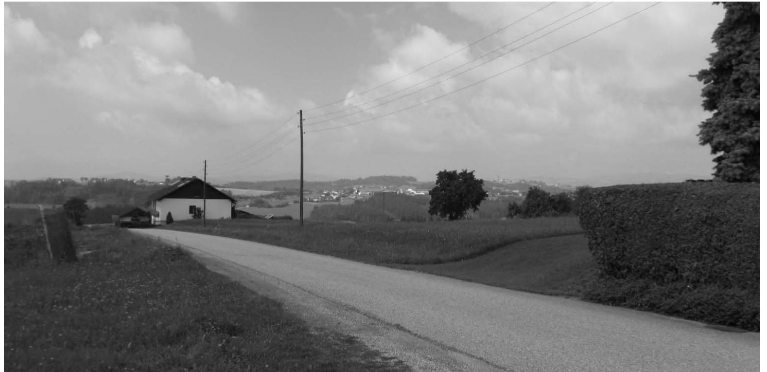
Der Lückenschluss im Dorfgebiet Halmenberg wird nun ermöglicht.

Aufgrund von Bedenken der OÖ Landesregierung wurden diese Verordnungen nicht genehmigt und bedurfte es eines längeren Abstimmungsprozesses mit den verantwortlichen Personen, welcher am 28. Juni 2010 abgeschlossen werden konnte. „Die Vertreter der Stadt Pregarten konnten dabei in wesentlichen Punkten überzeugen und so das bestmögliche Verhandlungsergebnis erzielen“, zeigt