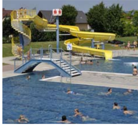
Holen Sie sich eine Abkühlung im Erlebnisbad LAGUNE

„Mit diesen Tipps für heiße Sommertage wünsche ich ihnen einen schönen Urlaub und schöne Ferien“, so Stadträtin Astrid Stitz.