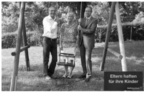
Danke an die Raiffeisenbank für das Sponsoring beim Kinderspielplatz Kalvarienberg