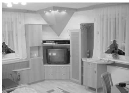
Ein fertiggestelltes Wohnzimmer der Fa. EDEH