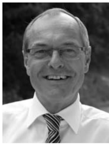
ANTON SCHEUWIMMER Bürgermeister Obmann des Ausschusses für Bildung & Kultur

Das bestehende Betreuungsangebot in den Räumlichkeiten der Volksschule wird seit Jahren dermaßen gut angenommen, dass für die nächste Zeit ein Neubau eines Hortes in die Wege geleitet werden muss.