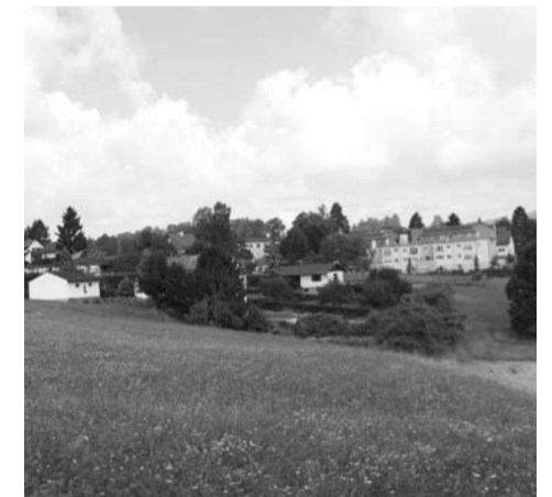
Im "Schulgraben" sollen Wohnbauparzellen entstehen.

Sobald Interessenten für diese Flächen vorhanden sind, kann mit der Planung der infrastrukturellen Erschließung begonnen werden.