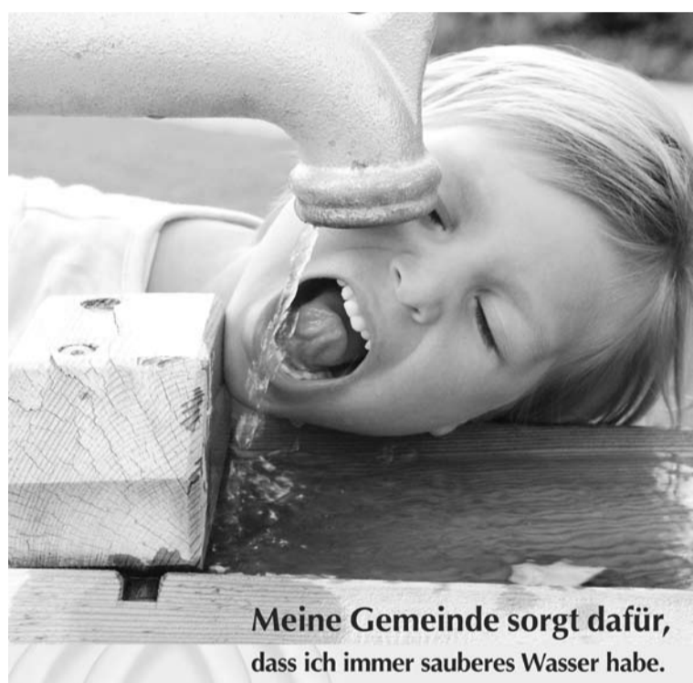
Meine Gemeinde sorgt dafür, dass ich immer sauberes Wasser habe.