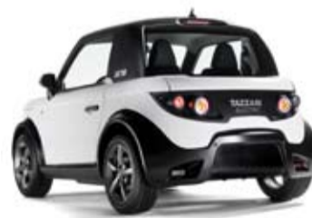
Zu sehen in Pregarten: Elektroauto Tazzari