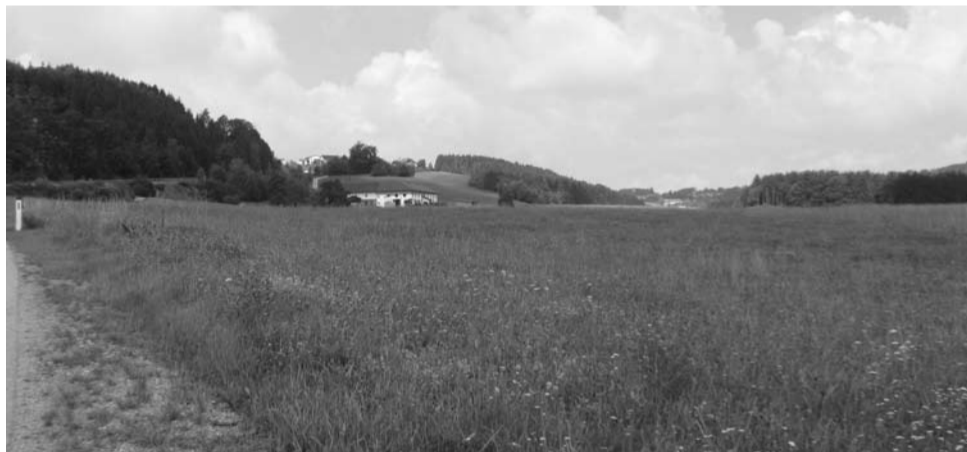
Hier in Burbach könnten schon bald Betriebe entstehen, die die wirtschaftliche Entwicklung Pregartens ankurbeln.