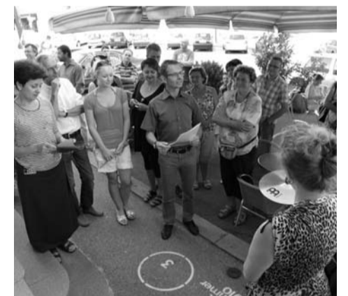
Bei der Eröffnung des Skulpturenparks in Pregarten