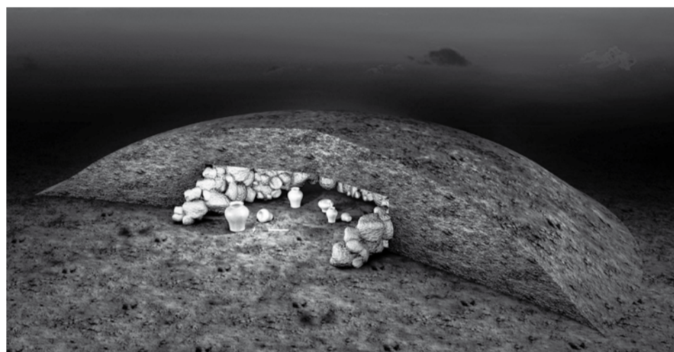
Grafische Rekonstruktion eines Hügelgrabes der Bronzezeit aus Unterweikersdorf. Illustration: BDA, G. Hartmann.

Umweltverträglichkeitsprüfung durch einen eigenen Fachgutachter für Kulturgüter betreut und in das Genehmigungsverfahren einbezogen. Im Ablauf des Bauprojektes wurden diese Vorgaben berücksichtigt und eine entsprechende Vorlaufzeit für die archäologischen Untersuchungen im Bauzeitplan eingeplant. Es wurde dadurch nicht nur ein ausreichender Zeitraum für die erforderlichen Ausgrabungen, sondern auch die Einhaltung der projektierten Bauzeit gewährleistet.