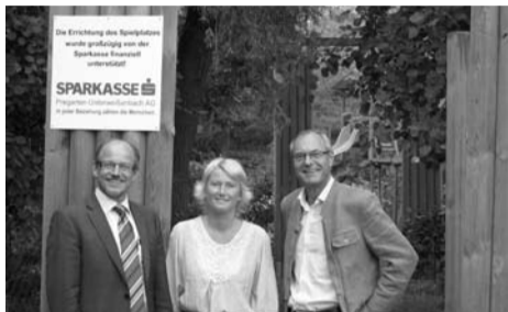
Ebenfalls gilt der Dank der Sparkasse für das Sponsoring des Kinderspielplatzes in Silberbach