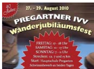
Besuchen Sie das großartige Fest

Das genaue Programm entnehmen Sie der Homepage www.pregarten.at bzw. Foldern.