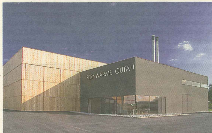
Das Fernheizwerk Gutau hat sich zwar einem alten, bewährten Brennstoff verschrieben, zeigt sich aber in moderner Optik.

Eine Besonderheit, auf die Obmann Pilgerstorfer mit den weiteren Genossenschafter stolz ist, ist die geplante und weitem einzigartige Zusammenarbeit mit der Biogasanlage Gutau. Diese speist nach Bedarf die Abwärme aus ihrer Stromproduktion in das Netz des Biomasseheizwerkes ein.